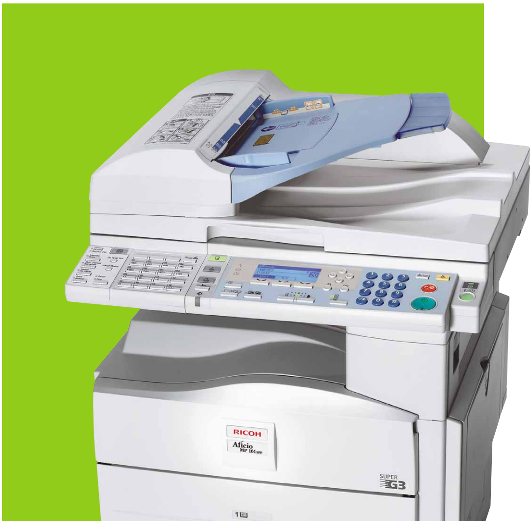
Aficio™ MP 161F/MP 161SPF